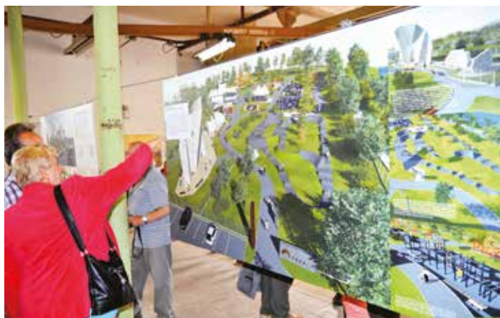
ČSSD chce v dalším období dokončit mnoho připravených projektů. Jedním z nich je volnočasový areál na Riviéře.

Myslím, že Frýdek-Místek se zase posunul, nemusíme se za něj stydět a nemusíme se ani stydět být na něj pyšní. Je to náš domov a skvělé místo k životu. Kdo vykřikuje něco jiného, tak toho nejspíš najdete na jiné než naší kandidátce... Vylosovali jsme si do voleb číslo jedna a já v tom vidím určitou symboliku, dostali jsme „jedničku“ a měli bychom být první volbou. Pro všechny, co se ve městě cítí dobře a bezpečně a chtějí mít jistotu, že to tak zůstane. Samozřejmě mít číslo jedna je i o štěstí. Ale to přeje připraveným. A my připravení jsme. (PR)