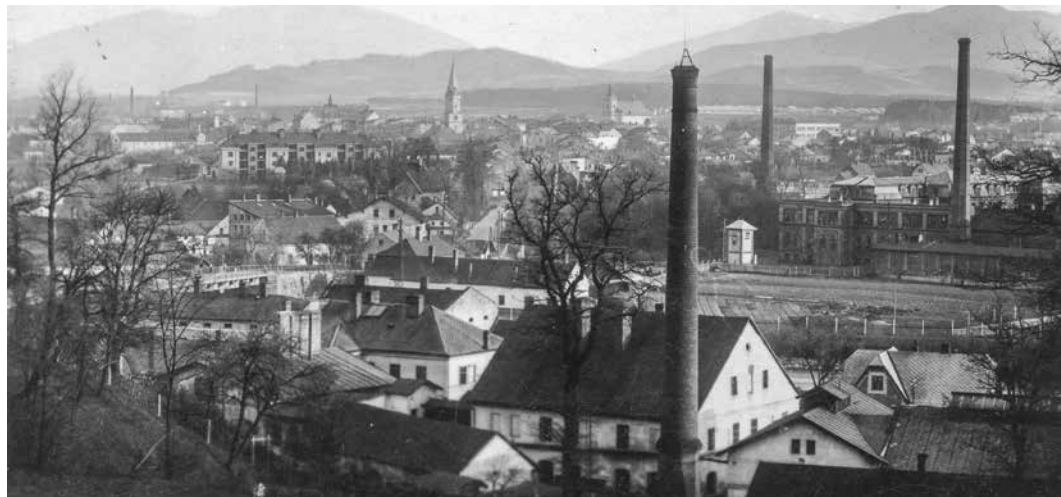
V popředí budovy stojící podél Karlshütterstrasse (pozdější Lipinská ulice, dnes ulice Míru), na níž se nacházel také Herliczkův dům