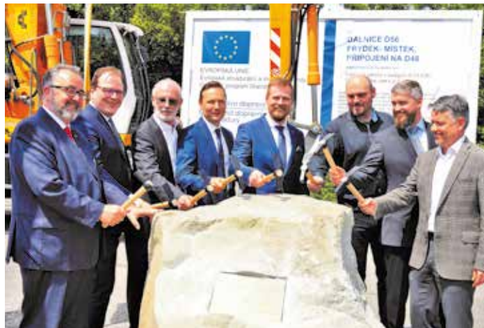
Povinná položka všech politických stran ve volebních programech zmizela – obchvat města už se staví.

Každý slušný pracující člověk, senior i začínající rodina s dětmi musí mít šanci sehnat kvalitní bydlení za rozumnou cenu, a ne za lichvářskou sumu, že po zaplacení nájmu pomalu nezbyvá už ani na jídlo. Postupně chceme vybudovat nové byty a začali jsme již koupit hotelu Centrum, který je jako stvořený pro startovací byty a bydlení pro seniory. Máme v plánu přebudovávat další nemovitosti, kupovat bytové domy, a dokonce i stavět nové byty. Nebudou ale pro nemakačenka a pro ty, co nechtějí přiložit ruku k dílu a vysávají jen sociální dávky ze státu. Zelenou u nás budou mít všichni slušní, pracující občané, senioři, rodiny s dětmi a lidé, ke kterým nebyl život milý a dal jim do vínku hendikep. Samozřejmě bude i neustálé rekonstruování městských bytů a zvyšování komfortu pro naše občany, a hlavně udržení nájmu na nižší úrovni, než se platí u soukromníků. Město nemá na občanech bohatnout, ale má jim zajišťovat kvalitní služby.