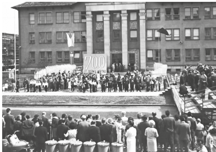
Zahájení oslav 700 let města Frýdku-Místku před branami průmyslovky 20. 6. 1965

Máme radost z toho, že např. v oblasti programování CNC strojů patříme dlouhodobě ke špičce v České republice, celostátních